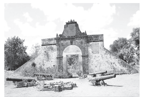
A Fortaleza de São Marçal de Sena, construída entre 1572 e 1590, foi o centro da presença portuguesa na África oriental nos séculos XVII e XVIII. Quando D. António Barroso por ali passou, teve um arroubo de indignação, como se escreve no texto. Actualmente, do forte de São Marçal resta apenas o portal amparado por obras feitas em 1905, com a colocação de um padrão comemorativo em 1906, conforme foto acima.

9 - BARROSO, António – Diário, citado por CUNHA, Amadeu – Jornadas e Outros Trabalhos do Missionário Barroso . Lisboa: Agência Geral das Colónias, 1938, p. 128.