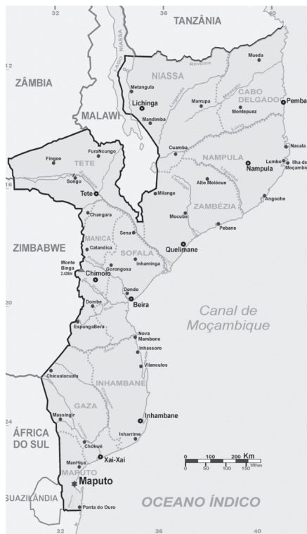
Mapa de Moçambique. As províncias de Manica e Sofala, no centro do país, são delimitadas pelo rios Zambeze a Norte, e Save, a Sul. Por estas terras inóspitas, na altura, D. António Barroso, caminhou e navegou durante mais de 2 meses, na visita pastoral que ali efectuou em 1892.

do muito de conhecer Gouveia, actualmente designada Catandica. No seu entender, foi um erro mudar dali para Massequece, actual Vila de Manique, a capital de Manica, que agora é Chimoio, como acima referimos. Confessa-se maravilhado com as plantações e culturas agrícolas ao cuidado de alguns soldados ali aquartelados. «Que beleza de produções!» exclamou D. António, esgravando as suas raízes rurais. (8)